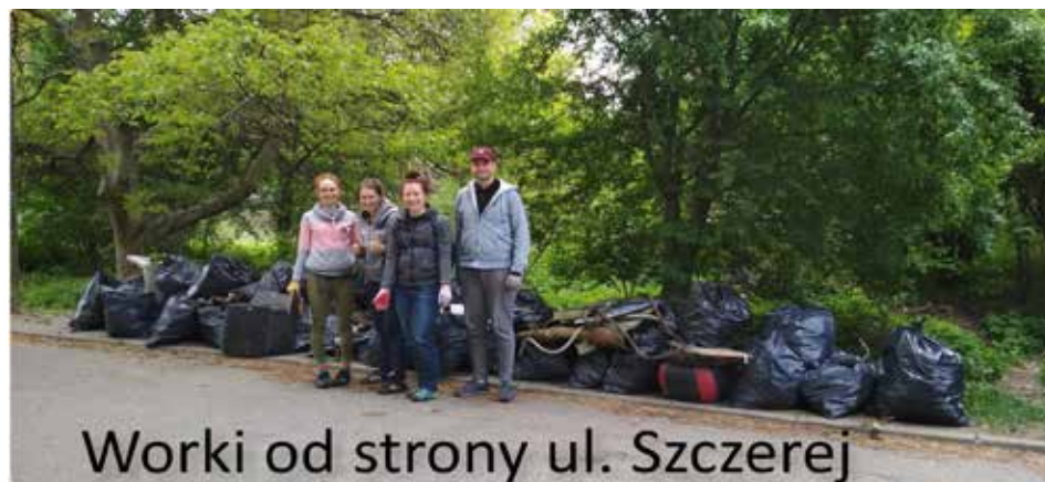
Worki od strony ul. Szczerej