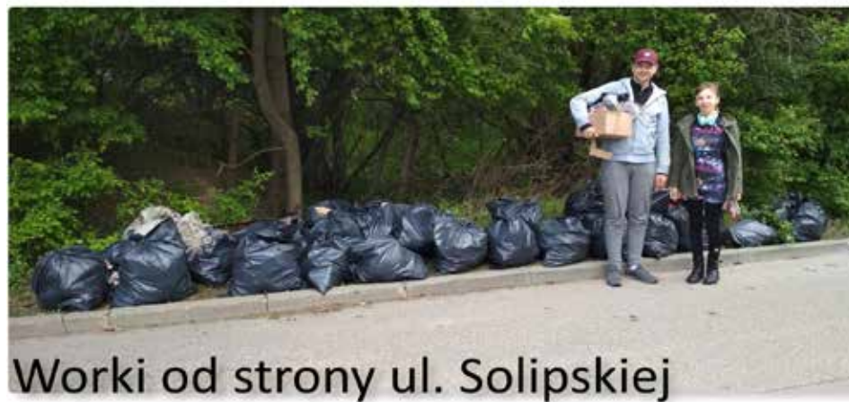
Worki od strony ul. Solipskiej